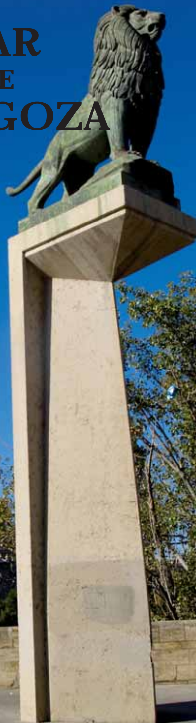
▲ Le Pilar, Saragosse