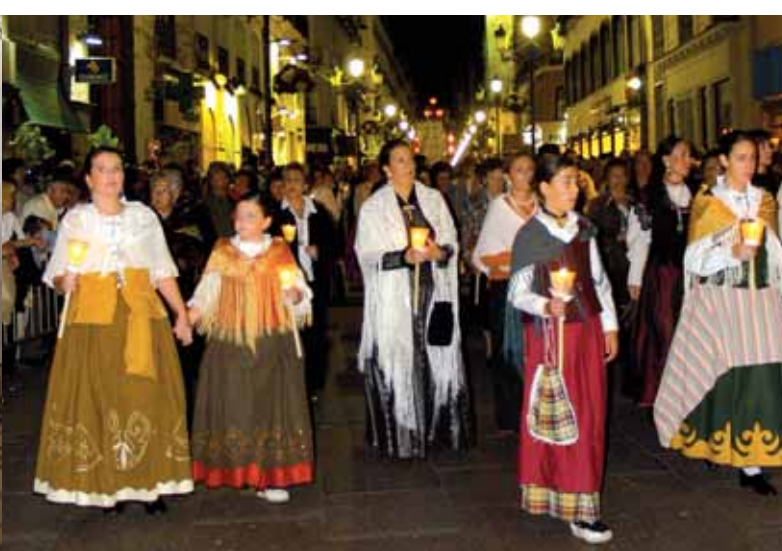
▲ Rosaire de Cristal, Saragosse