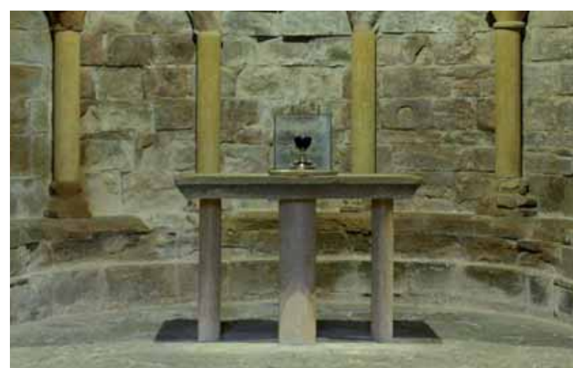
▲ Saint Graal (reproduction)

A la sortie de Jaca, dirigez-vous vers le Monastère de San Juan de la Peña, témoin de la naissance du Royaume d'Aragon et du passage du Saint Graal. Cherchez sous un imposant rocher le Vieux Monastère. Il fut fondé par les bénédictins au IX e siècle. Ce site particulier vous confessera les dégâts causés par les incendies et les gelées, il y en eut tellement qu'à la fin du XVI e siècle, il fallut construire le Nouveau Monastère en aval, sur une prairie plus ensoleillée, celle de San Indalecio. Il fut construit avec des porches baroques et chargés. Aujourd'hui c'est un ensemble totalement restauré par le Gouvernement d'Aragon qui abrite une Hôtellerie et un grand centre d'interprétation de ce que fut San Juan de la Peña dans l'histoire du Royaume d'Aragon. Approchez-vous du Balcon des Pyrénées. Vous trouverez peut-être un des gypaètes barbus, vautours, écureuils, chevreuils et cerfs qui fréquentent ces parages.