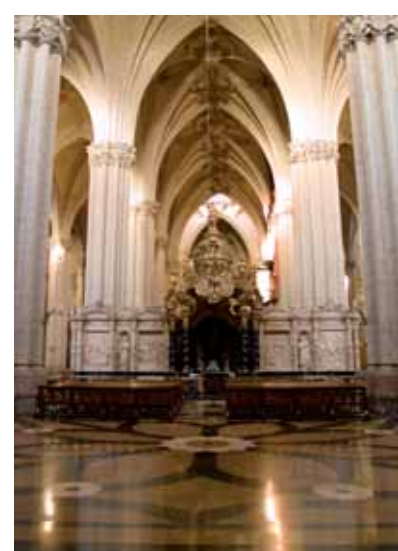
▲ La Seo, Saragosse