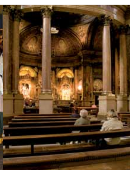
▲ Sainte Chapelle du Pilar

mètres de longueur sur soixante-dix de largeur. Vous pouvez passer des heures à contempler les coupes, dont deux furent peintes par le jeune Goya, génial artiste aragonais.