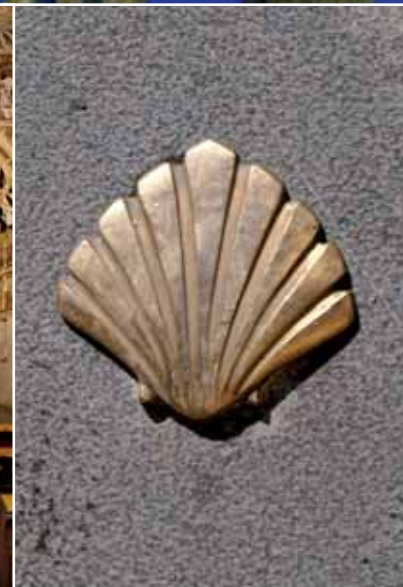
▲ Humilladero del Pilar, Saragosse