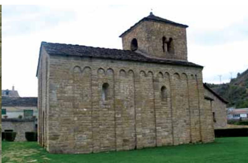
▲ Santa Cruz de la Serós

Puente la Reina de Jaca est un carrefour de chemins. Vous devez choisir entre une rive ou l'autre de la rivière Aragon. Celle de droite passe au milieu de paysages durs et peuplés de pins jusqu'à Berdún et Sigüés, les villages abandonnés Esco et Tiermas, le Château de Javier puis vous arriverez à Sangüesa, en territoire navarrais. N'oubliez pas le Monastère de Leyre. L'autre chemin est conseillé pour ceux qui voyagent à pied. Sans entrer dans Puente la Reina, dirigez-vous vers Arrés, un petit village avec son accueillant Hôpital des Pèlerins. Un exemple d'auberge traditionnelle où l'on s'occupera très bien de vous. De là vers Martes, sur des terres inégales vous arriverez à Mianos, Artieda, Ruesta et Undués de Lerda pour déboucher également à Sangüesa.