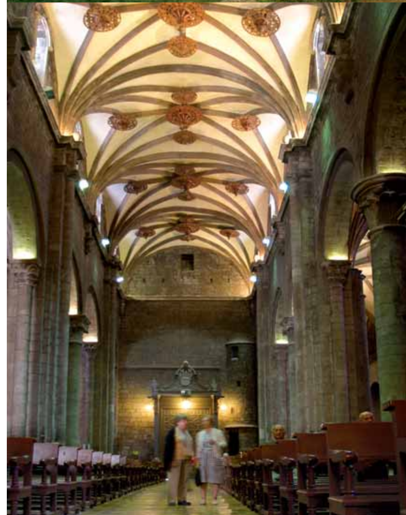
▼ San Adrian de Sasave