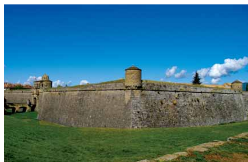
▲ Ciudadela de Jaca